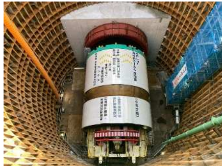
発進立坑内状況 (シールドマシン組立状況)