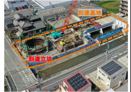
到達基地状況 (立坑築造状況)